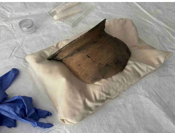
Caisson modulable Coussin de calage en coton et lentilles de polyéthylène recyclé pour la restauration

En parallèle de ces modèles, je me suis beaucoup intéressé à la problématique de la forte consommation de matériaux à usage unique en tamponnage, comme le film bulle et le scotch. Le développement de systèmes de tamponnages modulables et réutilisables a présenté de nombreux défis techniques, mais a abouti à la création d'un système de Wrap pour art graphique ne nécessitant ni outils, ni matériaux supplémentaires, ni découpes et assurant un tamponnage renforcé ultra rapide à mettre en œuvre. Pour les petits 3D, ce sont les coussins de calage qui se sont présentés comme la solution la plus vertueuse, la plus pratique, mais également la plus économique.