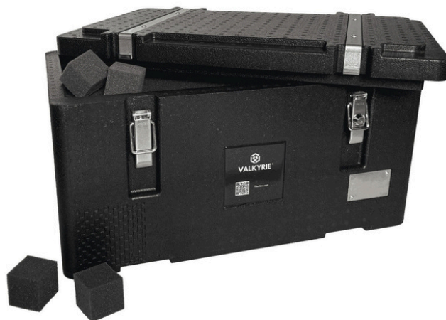
Caisson modulable Valkyrie

Pour les 2D enfin, nous avons créé une caisse permettant de transporter un ou plusieurs tableaux, encadré ou non, pouvant accueillir des fixations MRT ou des œuvres pré-conditionnées en caisson, voire une combinaison de ces différentes possibilités au sein d'une même caisse. Le système modulable est conçu de telle façon à pouvoir également être utilisé comme caisse à bancs pour des 3D assez plats comme de petites statues ou des stèles par exemple.